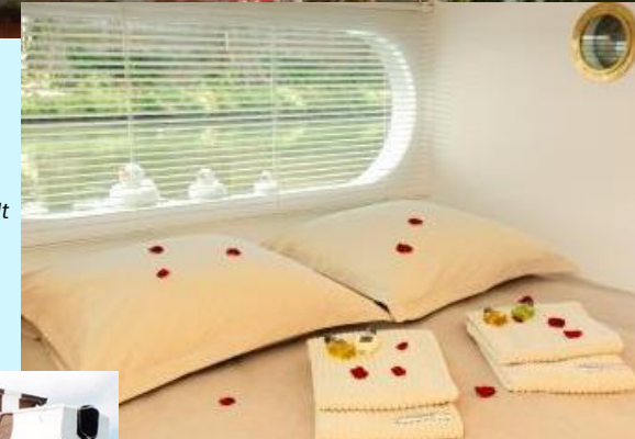
Foto: Péniche Chambre d'hôtes, Cers France, Languedoc Roussillon - Hérault