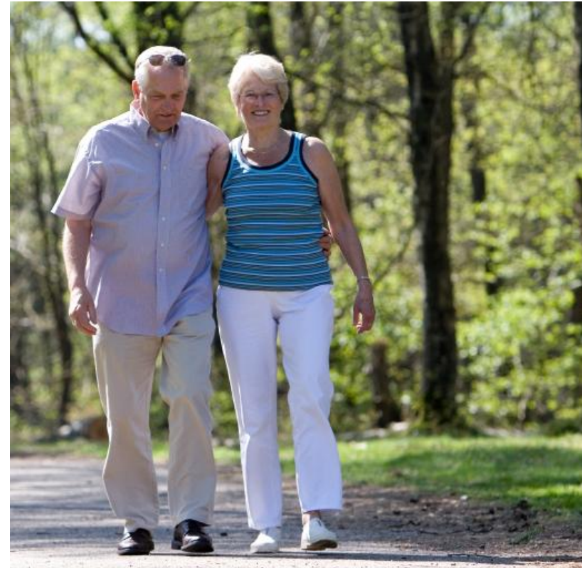
foto: "Wegwijs in de Bed & Breakfast sector" onderzoek van NRIT Media en Bed & Breakfast Nederland 2006/2007.

De B&B-bezoeker is vaak ook een milieubewuste consument, die respect heeft voor maatregelen die natuur en milieu beschermen, en is geïnteresseerd in streekproducten. Comfort is voor de B&B-bezoeker belangrijk, men rekent minimaal op hetzelfde comfort als thuis. De bezoeker verwacht een gastvrije service, persoonlijke aandacht en oprechte interesse. Ook de inrichting wordt steeds belangrijker.