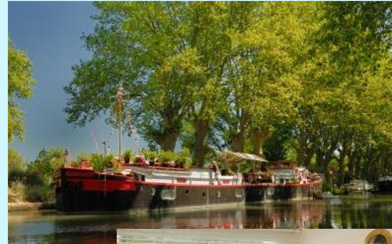
Chambre d'hôtes in een oude boot gelegen aan het Canal du Midi in Frankrijk!

Foto: Péniche Chambre d'hôtes, Cers France, Languedoc Roussillon - Hérault