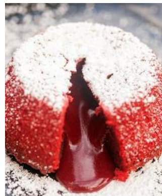
Gepind vanaf spachethespatula.com