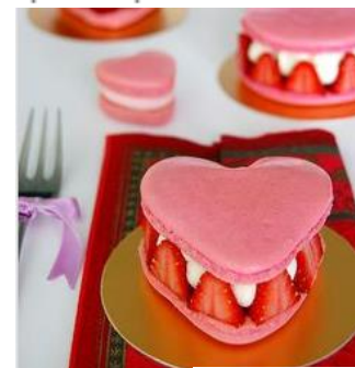
Gepind vanaf flickr.com

valentines day idea-fresh strawberries with vanilla cream and buttery shortbread pieces in the middle and assembled this combination with both 3' heart