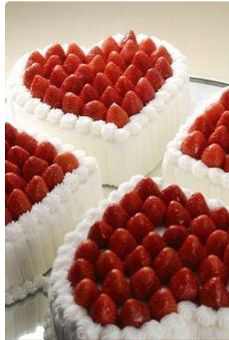
Valentine cake in Hilton

Gepind vanaf delectabledeliciousness.blogspot.com