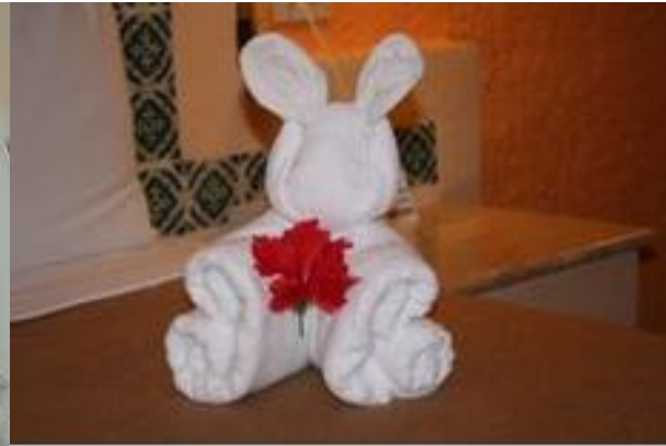
Valentines day towel hospitality