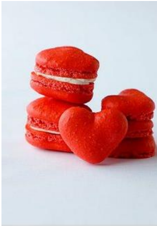
Valentine's Day DIY - red velvet heart macarons