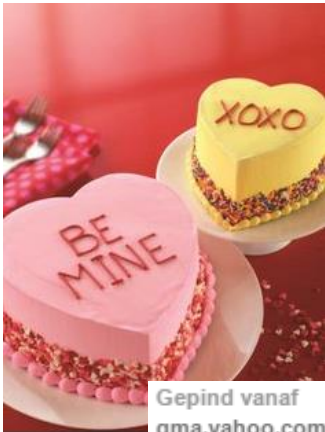
Gepind vanaf gma.yahoo.com

Meer op pinterest.com /horecatrendsnl/valentines-day/